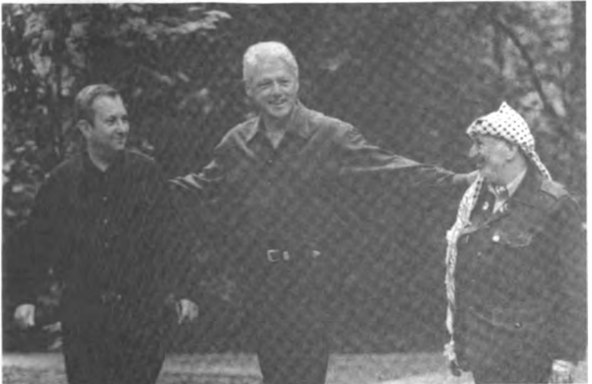
مع الرئيس الأميركي بيل كلينتون وإيهودا باراك